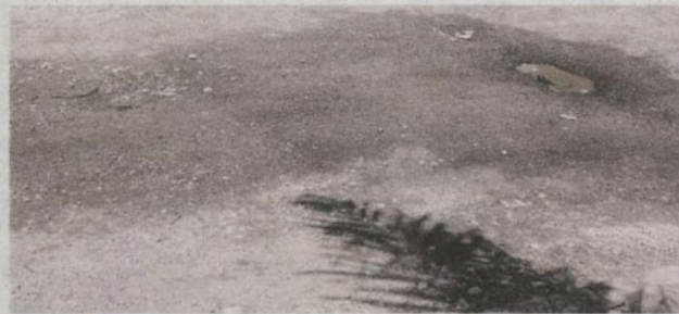
Permukaan jalan di persimpangan Taman Kem yang berlubang dan tidak rata membahayakan keselamatan pengguna jalan raya.