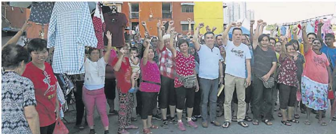
爱兰镇早市巴刹小贩希望巴刹在原地摆卖，不要搬迁。