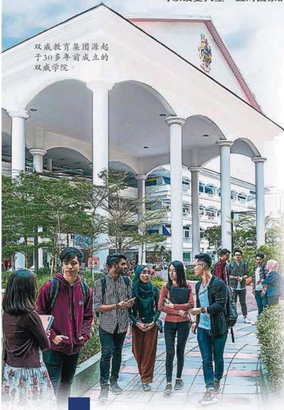
双威教育集团源起于30多年前成立的双威学院。

双威教育集团乃私人教育领域中家喻户晓的品牌。其创办人丹斯里谢富年博士坚信教育可以改变人生，且对国家的发展与进步扮演着至关重要的角色。此理念至今不曾改变。