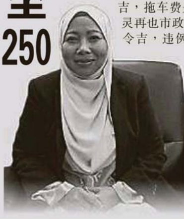
◀ 諾萊妮：明年起調整梳邦再也市議會管轄區內的拖車費至250令吉。