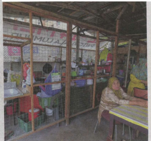
SEBUAH gerai makan yang diusahakan peniaga kecil di Lembah Subang, Selangor.

"Saya juga berusaha menjadi orang tengah antara peniaga dengan agensi kerajaan yang terlibat dalam menyalurkan bantuan melalui beberapa inisiatif di peringkat Negeri Selangor.