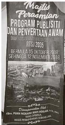
▲梳邦再也市议会从10月15日起至11月12日，前往市议会底层大厅服务柜台，以查阅2035年梳邦再也市议会发展蓝图草案 (RTSJ 2035) 的内容，并提出各种赞成或反对意见。