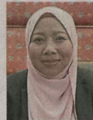
■诺莱妮:梳邦再也的拖车费和违例泊车罚款,分别调整为200及50令吉。

当低廉,须知巴生市议会的违例泊车的罚款是300令吉、拖车费是100令吉;八打灵再也市政厅的拖车费为150令吉,违例泊车的罚款也是150令吉,还不包括将车拖往停车场停放的费用。(TSO)