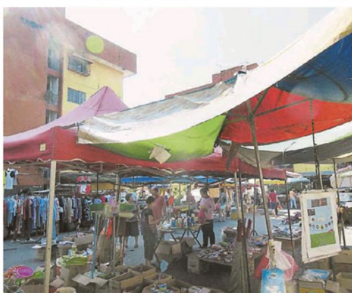
■爱兰镇早市巴刹已在组屋楼下经营30年。