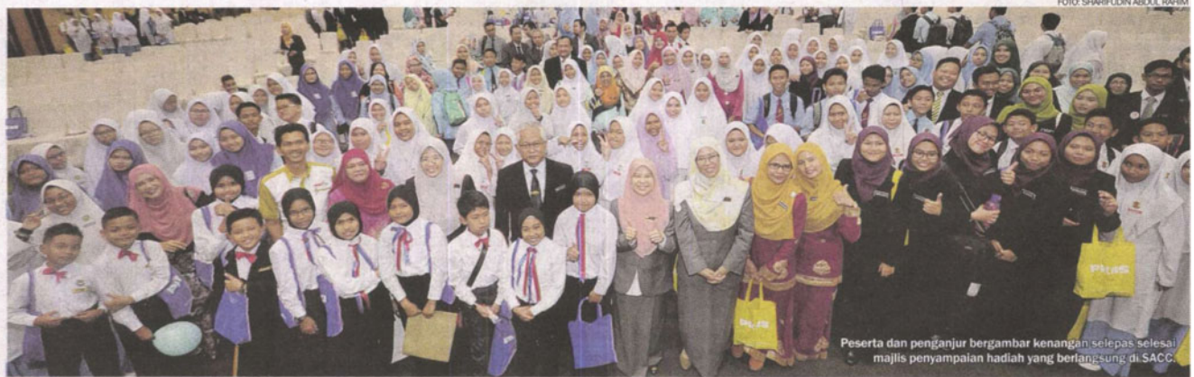
Peserta dan penganjur bergambar kenangan selepas selesai majlis penyampaian hadiah yang berlangsung di SACC.