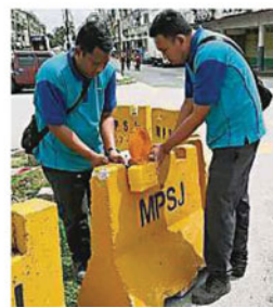
▲市議會工程組在接獲投訴後，採取迅速行動，置放障礙物並安裝警示燈。