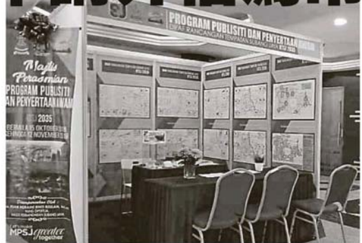
▲2035年梳邦再也市议会发展蓝图草案 (RTSJ 2035) 已在梳邦再也市议会大厅公开展示。