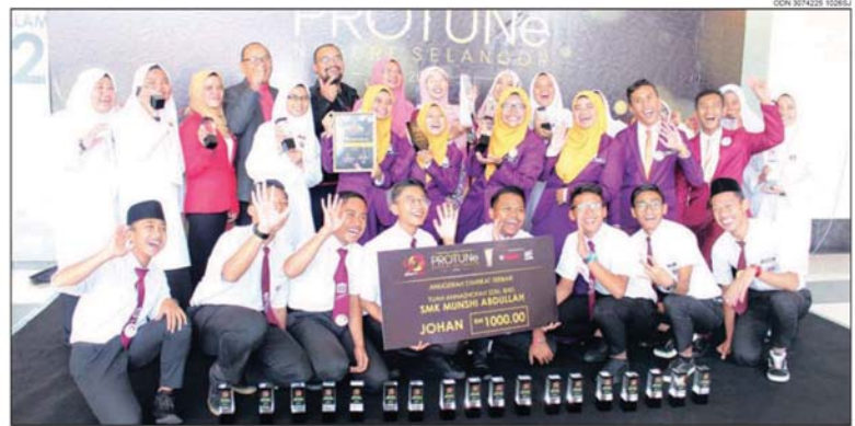
来自SMK Munshi Abdullah获得「最佳公司奖」的获奖团队合照。

她透露, 透过该活动可培育学生未来为雪州经济作出贡献。该机构深感荣幸雪州得以成为大马先进的州属, 尤其雪州为大马国内生产总值 (GDP) 贡献了