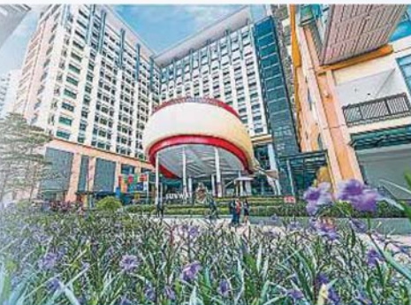
获得海内外认证的双威大学，为学子提供高质量教育。

著重全人教育的双威教育集团不仅提供学生优质的学术培训，也著重学生的品格塑造等全方位栽培。该教育集团目前的学生人数已超过3万人，并承诺将持续为莘莘学子提供优质教育。