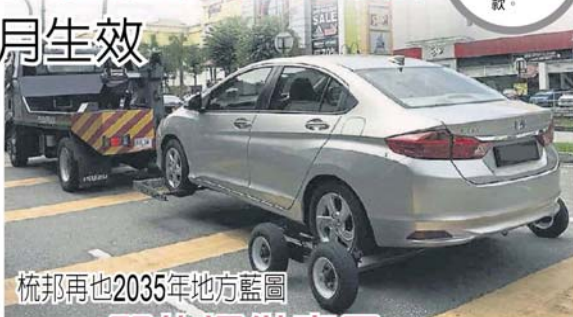
梳邦再也2035年地方藍圖

當天贖回只收RM50 她說，市議會雖然把罰款調漲至100令吉，然而若車主在當天就前往贖回汽車，市議會則只徵收50令吉。 “過去的20令吉罰款實在太低。” 她指出，被拖的汽車會存放在市議會的車庫中，每天的停放費用為10令吉，車主贖車時，須繳付拖車費、罰款及停放費。 她說，若車主在14天內就前往贖車，當局也會讓車主求情，把罰款折至50令吉。