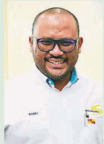
▲南利指出,若要达鲁益山集团豁免向雪州其中8个地方政府征收销售与服务税,必须由财政部向内阁提出相关建议。

有关地方政府包括沙白县议会、瓜拉雪兰莪县议会、梳邦再也市议会及沙亚南市政厅。该集团将于今年11月才接管沙白县议会的垃圾管理工作,之后轮到接管梳邦再也市议会与瓜拉雪兰莪县议会(明年1月同步接管)及沙亚南市政厅(明年7月才接管)。