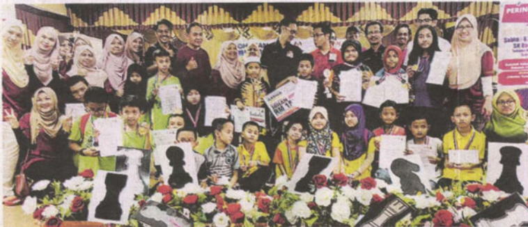
Pemenang Kejohanan Catur Terbuka Peringkat Negeri Selangor 2018 bagi setiap kategori meraikan kejayaan.

Bersaing dalam tiga kategori pada Kejohanan Catur Terbuka Peringkat Negeri Selangor