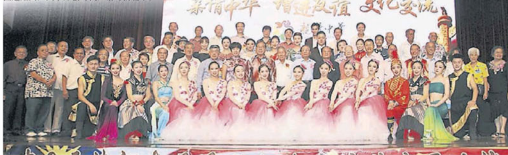
■中国天津市河东区侨联文化交流艺术团2018年来马义演吉隆坡站，圆满结束。

“马来西亚维护华教联合会代表团在509换政府后会晤教育部部长官，反映广大华社心声，其中一项课题是检讨《2013-2025教育大蓝图》，尤其对华教一切不利的条文都该删除，扫除心中的‘阴霾’，是全体华社的意愿。”