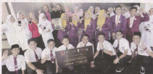
SMK Munshi Abdullah berjaya mempertahankan 3 kali Anugerah Syarikat Terbaik di Konvensyen PROTUNE.

PROTUNE dipertandingkan iaitu Kejohanan Hartawan Saidina 3x, Anugerah Perkhidmatan Terbaik, Produk Inovasi Terbaik, Laporan Kewangan Terbaik, Pekerja Terbaik, Pengurus Terbaik, Guru Pembimbing Terbaik, Pengetua Terbaik, Sekolah Terbaik, Persembahan Ter-